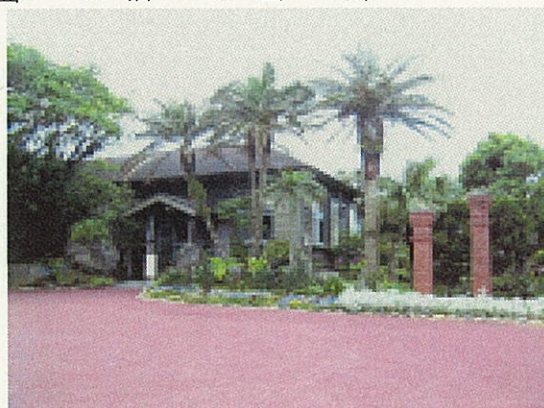
八丈島歴史民俗資料館 Tel. 2-3105