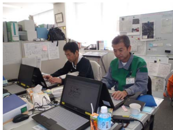
大島における業務状況(右側が筆者)

11月7日から半月の日程で大島支庁に応援に行ってきました。現地では、毎日、大島町長を筆頭とする本部会議が開かれ、その場に同席する機会もありました。会議では、35名の尊い命を失ったことを重く受け止め、復興に向け白熱した議論が日々行われていました。派遣を終え、八丈島・青ヶ島でもこの経験を生かしていきたいと考えています。