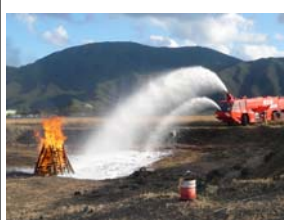
化学消防車による消火訓練

11月22日に空港の関係機関が参加し、消火救難訓練を実施しました。ご協力ありがとうございました。