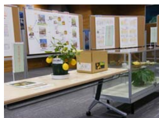
企画展示「菊池レモン」

今注目の「菊池レモン」に関して、島しょ農林水産総合センターにおける研究成果や農家の取り組みを、写真やパネルを使って紹介しています。期待される島の宝物をぜひご覧ください。