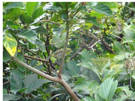
写真の中に伊豆諸島固有の「シチトウメジロ」がいます。どこにいますでしょうか？