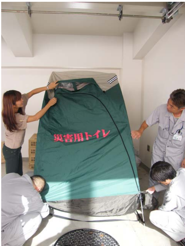
マンホールトイレ設置訓練(八丈支庁)