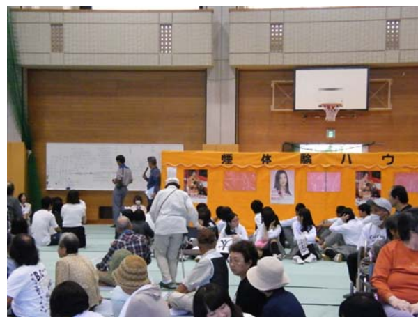
八丈町防災訓練 避難会場(八丈高校)

八丈地方隊も関係機関と連携して住民の避難誘導などを行うとともに、避難道路の検証などを行いました。