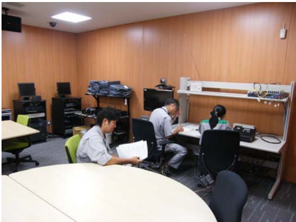
支庁防災対策室における無線通信訓練 総務課庶務係 2-1111

支庁では、村から依頼のあった避難用ヘリコプターの出動要請や、八丈島での一時避難場所の確保などについて、村役場との間で防災無線を活用した通信訓練を行いました。