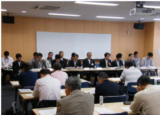
八丈町住民代表者への説明会

本年 4 月から新庁舎での業務を開始していますが、旧庁舎の解体と外構工事を今年度から来年度にかけて実施します。