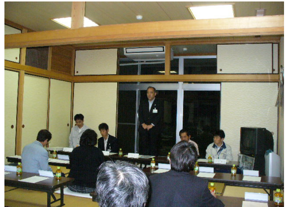
青ヶ島村住民代表者への説明会

水産振興では水産加工の取組みやサメ防除対策への支援、漁業関連施設等の防災力強化対策に取り組めます。