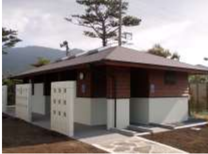
全面改修したトイレ