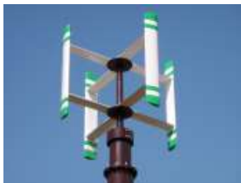
風車(上)と風力発電施設(下)