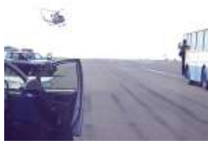
犯人を包囲するヘリ・パトカー

逃亡機に見立てたバスの周りを警視庁のパトカーやヘリコプターが取り囲み、犯人との交渉の結果、二人の人間が解放され、その後、逃亡用の飛行機に乘換えるタイミングで、犯人を取り押さえることが出来ました。