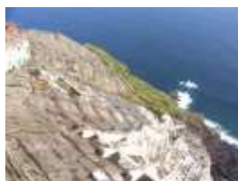
大千代復旧治山工事

●飛砂や強風から、檜立地区の住宅や畑などを守るため、約 1 千万円をかけてクロマツ等の植栽及び防風丸太柵