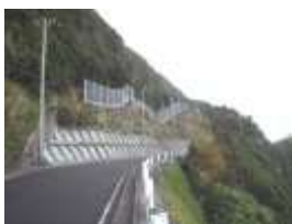
末吉地区の工事箇所

今年度は、八丈島で登龍道路や末吉等の3箇所、青ヶ島では上手回りの2箇所において、自然環境に配慮して事業を実施しています。