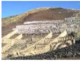
設置した丸太防風柵

20年度は土砂の安定を図るため、潮風や乾燥に強いクロマツ、トベラ、オオバヤシバシを植