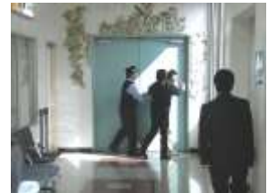
不法侵入者への対応

ころで、警察・HAT・警備会社の関係職員との連携により、他の乗客の安全を図りつつ不法侵入者を確保することが出来ました。