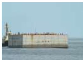
神湊漁港防波堤ケーソン

●港湾課では、約 38 億円で港湾・漁港・空港を整備しました。内訳は港湾整備で約 15 億 2 千万円、漁港整備で約 22 億 2 千万円、空港整備で約 8 千万円でした。