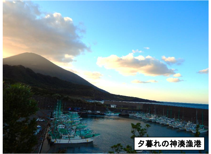
夕暮れの神湊漁港

秋晴れが続いていた八丈島ですが、夕方の日の短さを見ると、冬へと季節が移り替わっていく感じが感じられます。12月下旬には、一年で最も日照時間が短くなる「冬至」があります。東京では、冬至の日は、夏至の日（最も日照時間が長い日）と比べて5時間近くも日照時間が短くなります。季節の変わり目で体調を崩しやすい時期ですが、冬至の文化である、かぼちゃの煮つけや柚子風呂などを満喫しながら、健康に過ごしましょう！