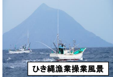
ひき縄漁業操業風景