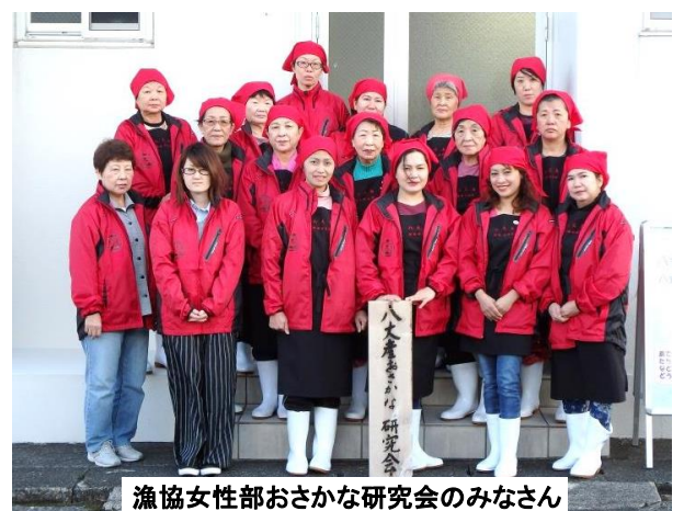
漁協女性部おさかな研究会のみなさん