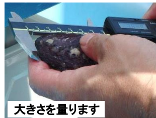
大きさを量ります