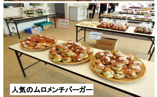
人気のムロメンチバーガー