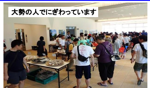
大勢の人でにぎわっています

毎月第三土曜日、底土船客待合所で開催されている、漁協女性部の「朝市」には、八丈島で獲れた新鮮な魚を切り身にしたものや、惣菜に色々アレンジした商品が並び、好評です。また、農協女性部による野菜販売等もあり、毎回オープン前から長蛇の列ができる盛況ぶりです。普段あまり魚を食べない人も、朝市の商品を通して、魚のおいしさを実感してくれたら嬉しいですね。なお、人気の商品はすぐに完売してしまうので、お早目のご来場を。