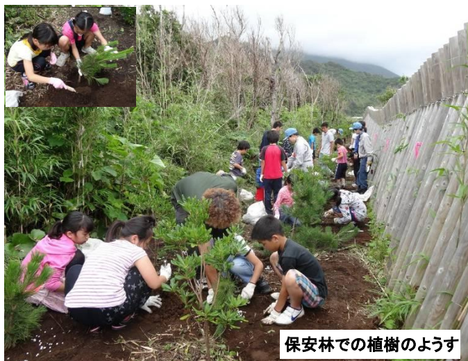
保安林での植樹の様子

島のあちらこちらにあるハイビスカスが色鮮やかな花を咲かせて、本格的な夏の訪れを告げています。