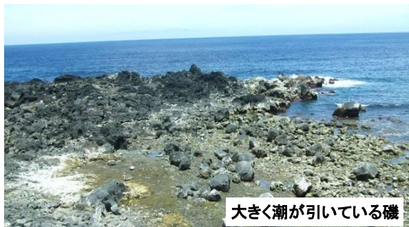
大きく潮が引いている磯

今年4月上旬、黒潮はN型と呼ばれる直線的な流れをしていましたが、だんだんと蛇行しはじめ、5月後半にはC型と呼ばれる八丈島の南側を回るような流れになりました。黒潮が蛇行すると、黒潮と本州南岸の間に下層の冷たい水が湧き上がり、冷水塊と呼ばれる冷たい大きな海水の塊が発生することがよくあります。冷水塊に覆われた八丈島では、漁港での海水温が18~20℃と例年より2~3℃低くなりました。さらに干潮の時、大きく潮が引くために、ふだんは海の中にある岩などが水面から出てしまい、海藻が枯れて白くなり、磯が真っ白に見えました。