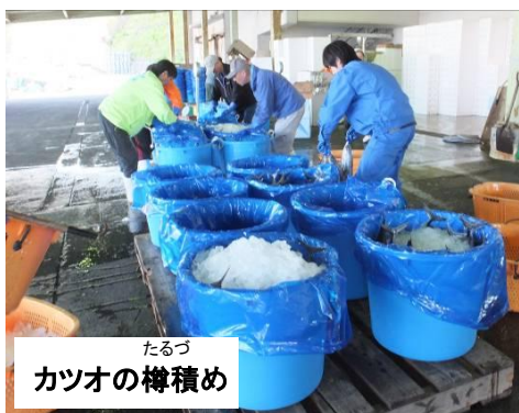
たるづ カツオの樽積み