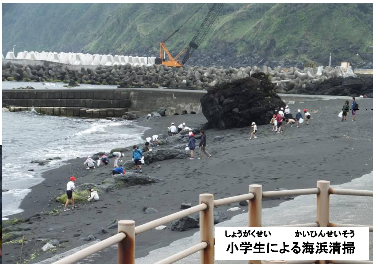
しょうがくせい かいひんせいそう 小学生による海浜清掃

5月に入り、さらに日差しが強くなりました。先日、小学生による砂で八丈島などを形作る砂浜アートと海浜清掃がありました。本格的な海水浴シーズンを前に、浜をきれいにするための活動です。浜ではハマボスの花が満開です。今年の大連休は晴天に恵まれ、ダイビングや釣り、温泉などを楽しむたくさんの観光客で島はにぎわい、早くも海で泳ぐ家族連れも見られました。