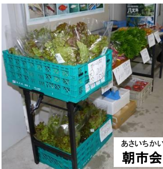
あさいちかいじょう ようす 朝市会場の様子