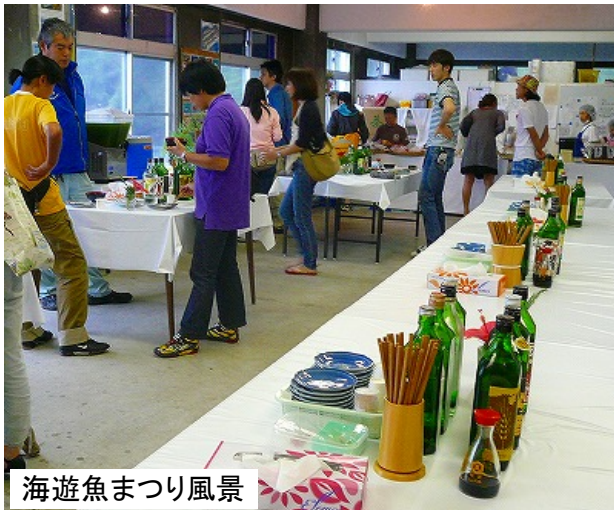
海遊魚まつり風景

八丈町では、島を訪れるお客さんに無料で島の味を楽しんでいただく「海遊魚まつり」を開催しています。新鮮な刺身、漁協女性部手作りのさつま揚げやムロ節ごはんなどに島の焼酎を添えて、お客さんを歓迎します。先日も、「ここでご馳走になっていい気分だ〜。」とほろ酔い加減でとても楽しそうな方がいらっしゃいました。11月いっぱいのお金・土・日・祝日の午後2時から4時まで三根地区にある底土の漁師小屋で開催されています。