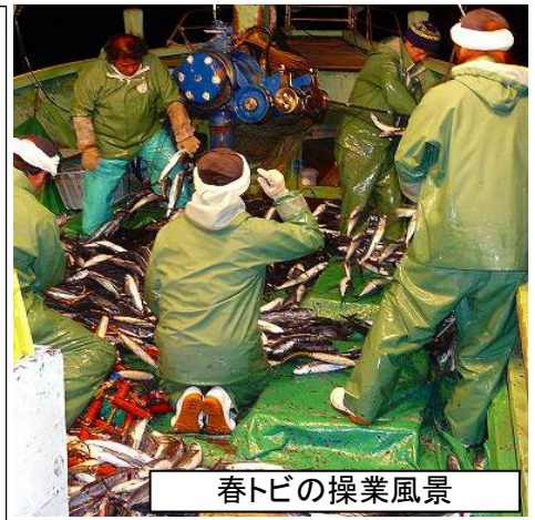
春トビの操業風景