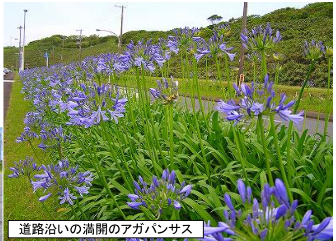
道路沿いの満開のアガパンサス

八丈島では、ソテツが新しい葉を出し、道路沿いにはアガパンサスが満開です。梅雨の中休みには、青い空にひんやりとした初夏の風がとてもさわやかです。これからは夏のイベント「八丈島夏まつり」等があり、沢山の人が島を訪れいよいよ本格的な夏を迎えます。