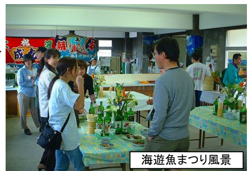
海遊魚まつり風景

海遊魚まつりは、島を訪れる方々に島の味を知っていただく八丈町のイベントです。女性部手作りのさつま揚げやお刺身の試食は、会場を訪れたお客さんから大好評です。八丈島には1日にジェット機が4便飛んでおり、羽田空港からわずか50分で八丈島に到着です。中には、「海遊魚まつり」のために日帰りでご参加されたお客さんもいらっしゃいました。