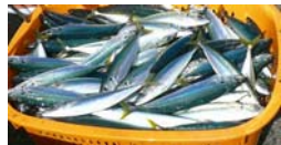
ムロアジの漁獲量の推移(トン)