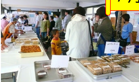
6月の朝市風景(東海汽船横)