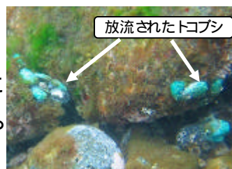
放流されたトコブシ

6月8日、八丈島の中之郷の海に、大島の栽培漁業センターで約2cm位に育てられたトコブシの稚貝約8万個が放流されました。他の地区は、これから放流予定ですが、八丈島のトコブシが少しでも増えることを祈ります。