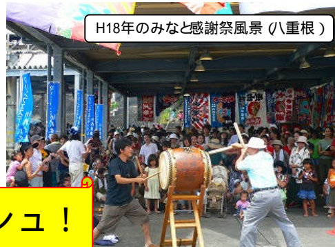
H18年のみなと感謝祭風景 (八重根)

毎年、「海の日」には、みなと感謝祭が八重根と神湊の両漁港で交互に開催されます。今年の会場は神湊です。当日は、島料理の試食や即売会、乗船体験が予定されています。