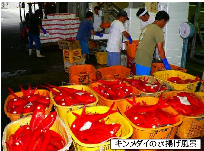
キンメダイの水揚げ風景

梅雨なのに、あまり雨が降らず、道ばたにはガクアジサイが太陽を浴びて元気に咲きほこっています。これからは夏のイベント、夏まつり等があり、観光客が沢山訪れます。