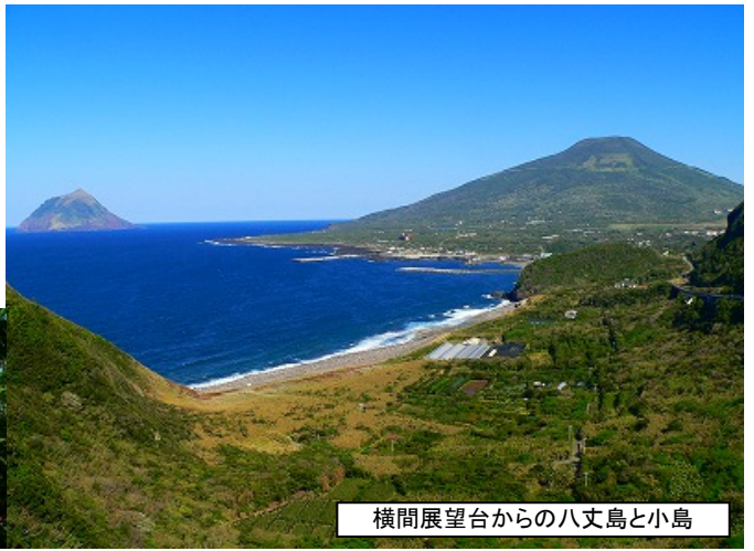
横間展望台からの八丈島と小島

八丈島は東京から南へ約290km、太平洋に浮かぶ、伊豆諸島で二番目に大きな島です。春は、寒くもなく暑くもなく、とても過ごしやすい最高の季節でしたが、やがて梅雨に入ります。