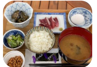
▲和食 使用食材:明日葉、地魚