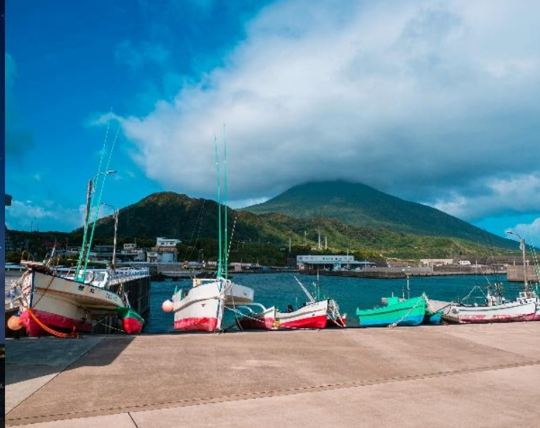
▲風景部門 八丈島漁業協同組合賞 BOUJIN 様