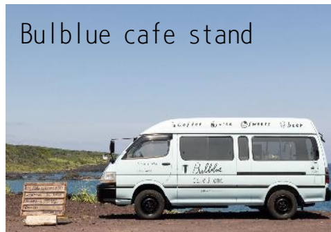
Bulblue cafe stand