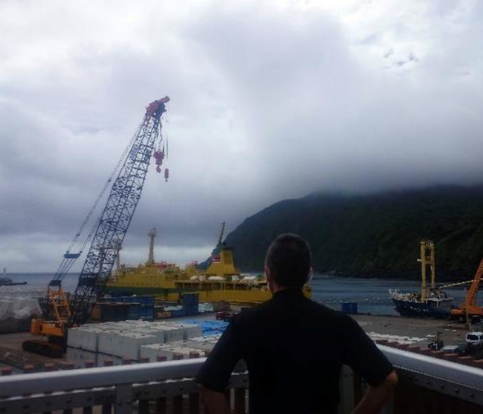
▲思い出部門 東海汽船賞 USUBA 様