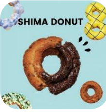
▶島とうどーナツ 使用食材:島唐辛子