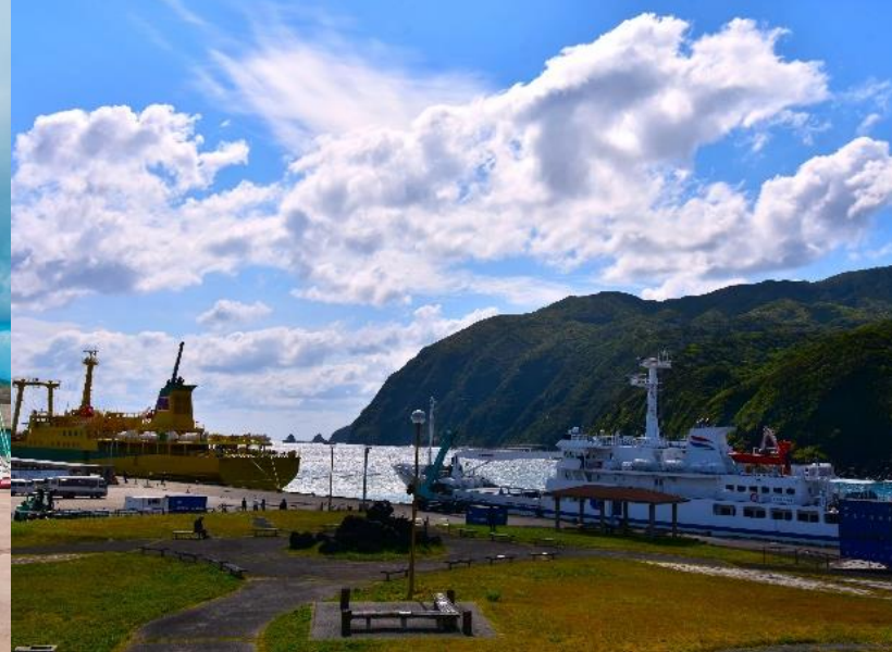
▲風景部門 東邦航空賞 雄勝 裕一 様