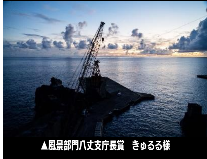
▲風景部門八丈支庁長賞 きゆるる様