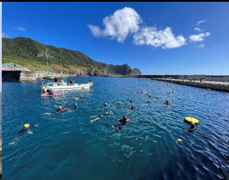
▲思い出部門 八丈島漁業協同組合賞 川畑 伊豆海 様