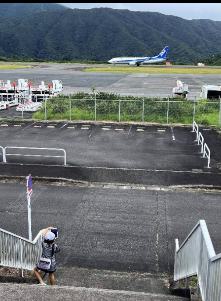
▲思い出部門 八丈島空港ターミナルビル賞 ぶーたん 様