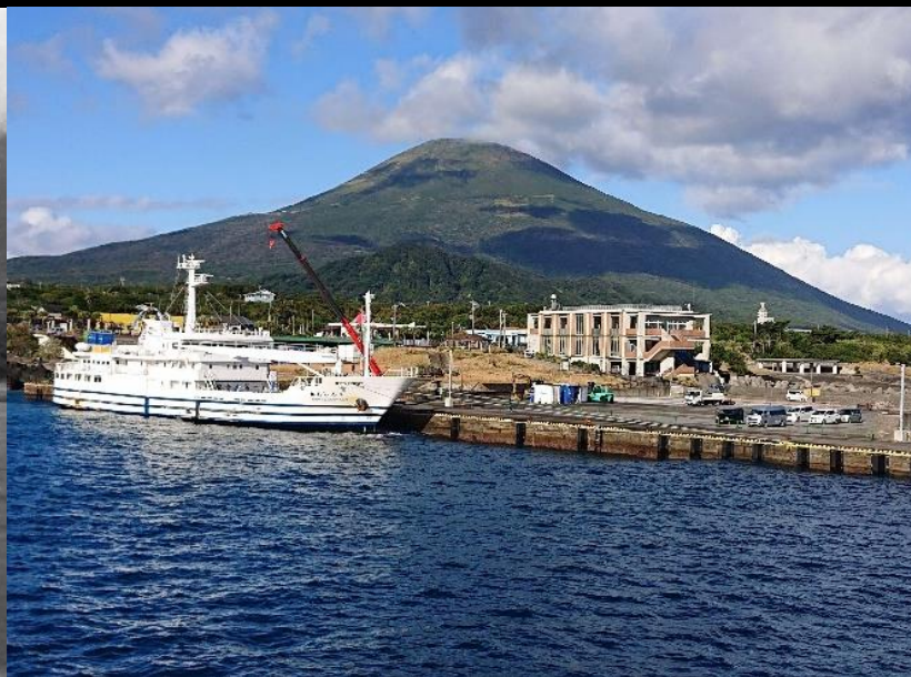
▲思い出部門 伊豆諸島開発賞 kiki 様