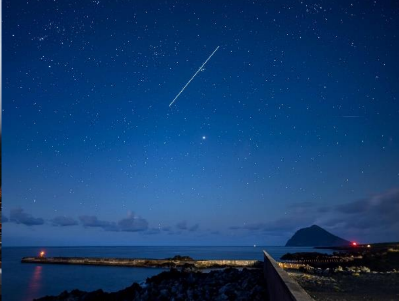
▲風景部門 東海汽船賞 ノダノラコ 様