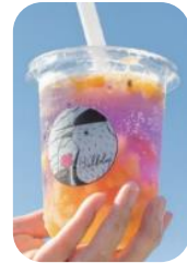
◀トロピカルソーダ 使用食材:パッションフルーツ