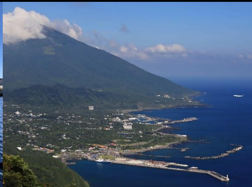
▲風景部門 八丈島空港ターミナルビル賞 西澤 優治 様