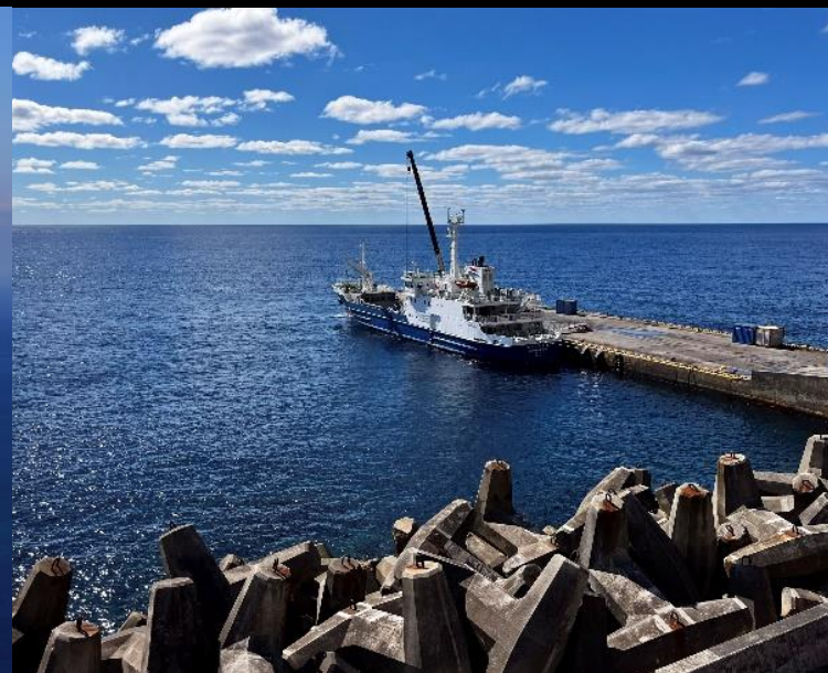
▲風景部門 伊豆諸島開発賞 たみばば 様