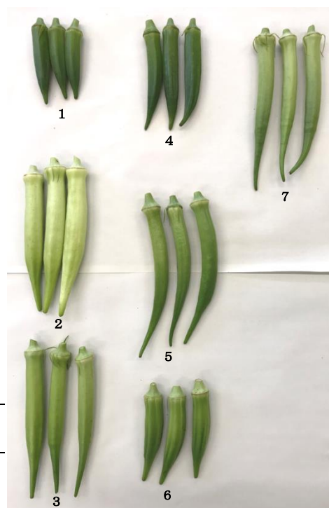
図2 オクラ各品種の外観

1 : グリーンソード, 2 : ヘルシエ, 3 : レディーフィンガー, 4 : 平城グリーン, 5 : エメラルド, 6 : クリムソン・スパインレス, 7 : 八丈系統