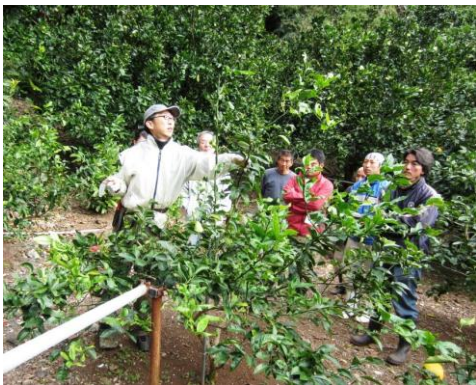
図 剪定研修会の様子(母島)

そこで、農業センターでは、一昨年から、レモンに関する様々な研修会を開催して、生産現場が抱えている技術的課題の改善に取り組んでまいりました。今年1月19日～20日に母島で開催した研修会では、新規導入や生産拡大を検討している生産者を中心にのべ30名以上の参加があり、樹齢や樹勢ごとに異なる剪定方法について実演・実習しました。また、接木についても、穂木の採取・保存方法から、接木後の新梢の管理方法まで具体的に実演しました。二年続けて実習に参加した参加者からは、上達を実感したとの意見が多く聞かれました。1月22日には、父島でも剪定研修会を開催し、レモンに長年取り