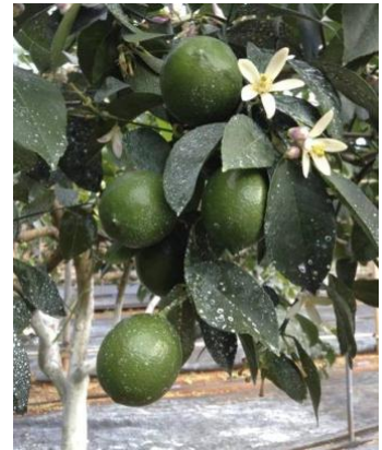
(池田) 図2 秋季開花由来果実と春季開花

開花時期ごとに果実特性を調査したところ，夏季開花の果実は果皮と内袋が薄く，果汁歩合は高く，秋季開花の果実は種子が少ないことがわかりました。食味はいずれも春季開花の果実と同等で，商業利用が可能です。収穫適期は，春季開花は9月上旬から10月中旬，夏季開花は11月上旬から下旬，秋季開花は4月下旬から5月下旬でした。