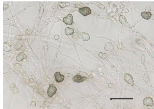
図4 分離菌の付着器 (図中のバーは20μmを示す)