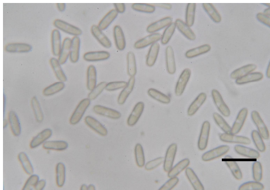
図3 分離菌の分生子 (図中のバーは20μmを示す)