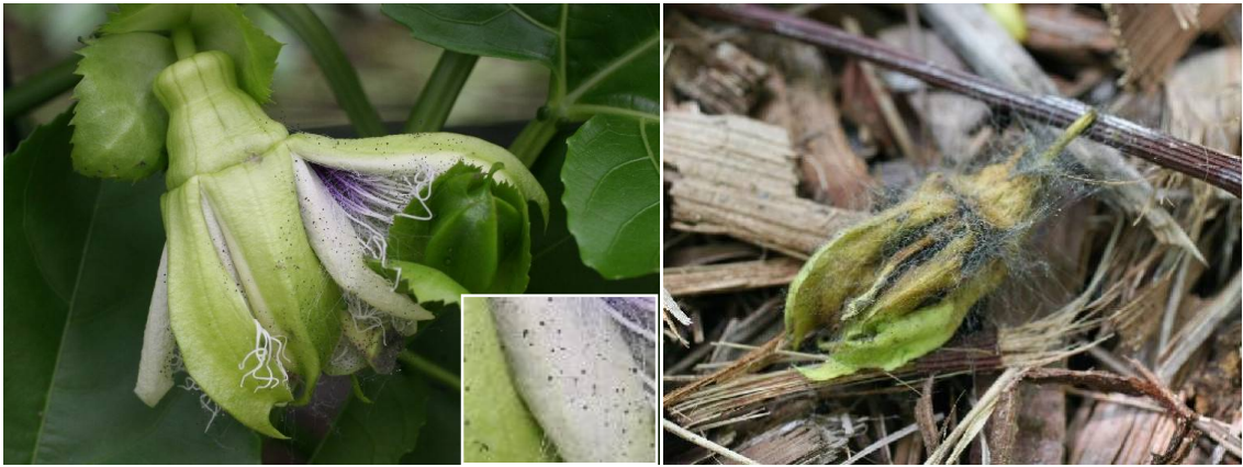
図1 パッションフルーツ黒かび病の病徴