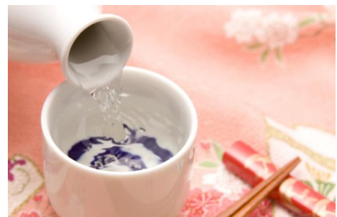
多摩の酒 飲み比べ（イメージ）