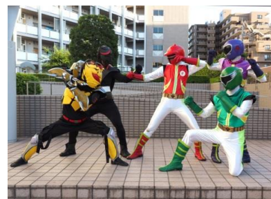
ご当地ヒーロー（イメージ）