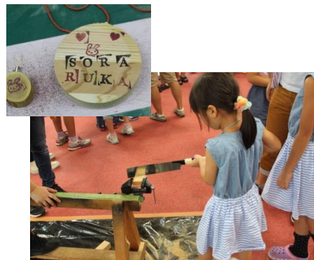
木育教室（イメージ）