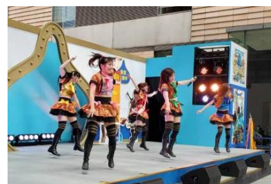
ご当地アイドル（イメージ）