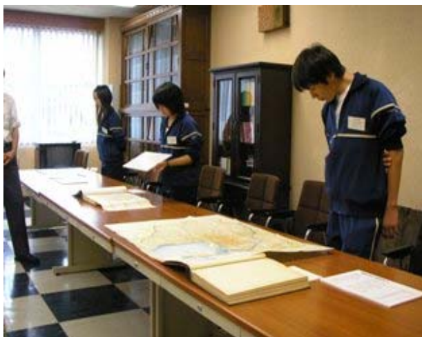
【パネルを手に発表を行う生徒】

資料やパネルを用いて、『江戸時代の大森の名物』、『東京35区と大森区、東京22区と大田区』など、江戸～昭和初期の大森地区をテーマとしたミニ展示の作成をしました。午後には当館職員と指導巡回で来館した同校教員の前で、午前中の成果を一人ずつ発表しました。最後に各自で今回体験した業務のまとめを行い、この3日間を締めくくりました。