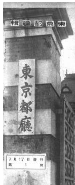
【丸の内庁舎に新しくかけられた「東京都庁」の看板(都政週報)】

今回は、来るべき東京大空襲に備え都庁誕生からわずか半年後に実施されたこれら東京府・市文書の疎開作業について見ていくことにしましょう。