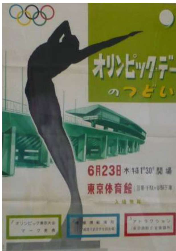
【オリンピックデーのつどい ポスター】

➤ オリンピック準備事務局設置公文書 昭和 34 年(1959)9 月 16 日起案 招致決定の 5 ヶ月後 10 月 10 日に都は「オリンピック準備事務局」(翌年 7 月にオリンピック準備局に組織改正)を広報渉外局に設置しました。同事務局は、競技場・選手村の設置だけでなく、