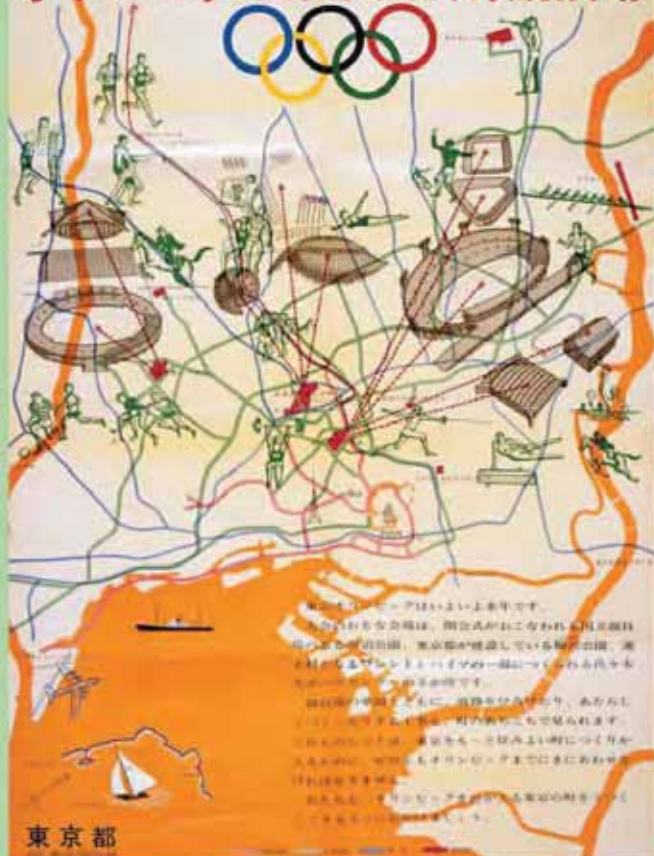
生活文化スポーツ局引継ぎ「オリンピック絵新聞」(1962年オリンピック準備局作成)

東京都公文書館では、 随時公文書引継ぎのご相談に応じています。 詳細はTAIMS「公文書館利用案内」をご覧ください。