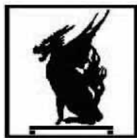
〈「東京市史稿」表紙の麒麟〉

http://www.soumu.metro.tokyo.jp/01soumu/archives/index.htm