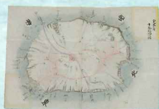
八丈島二 小島之図