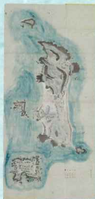
新島之図 伊豆七島ノ三