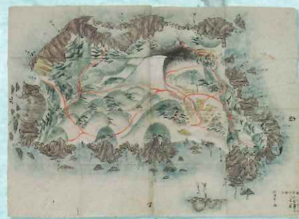
神津島之図 伊豆七島ノ五