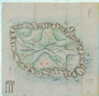
御蔵島之図 伊豆七島ノ七