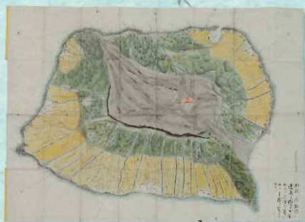
大島之図 伊豆七島ノ一