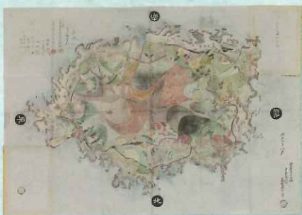
三宅島之図 伊豆七島ノ六