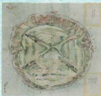
利島之図 伊豆七島ノ二