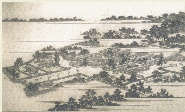
東京市養育院 大塚本院

本企画展は、両館の共催により、東京におけるハンセン病対策の歴史を見つめなおし、偏見差別の解消や名誉回復などの課題を広く共有していただくことを願って開催するものです。あわせて、不当な偏見や差別を歴史的に検証していくうえで、記録資料の果たす役割についても、改めて考える機会となれば幸いです。