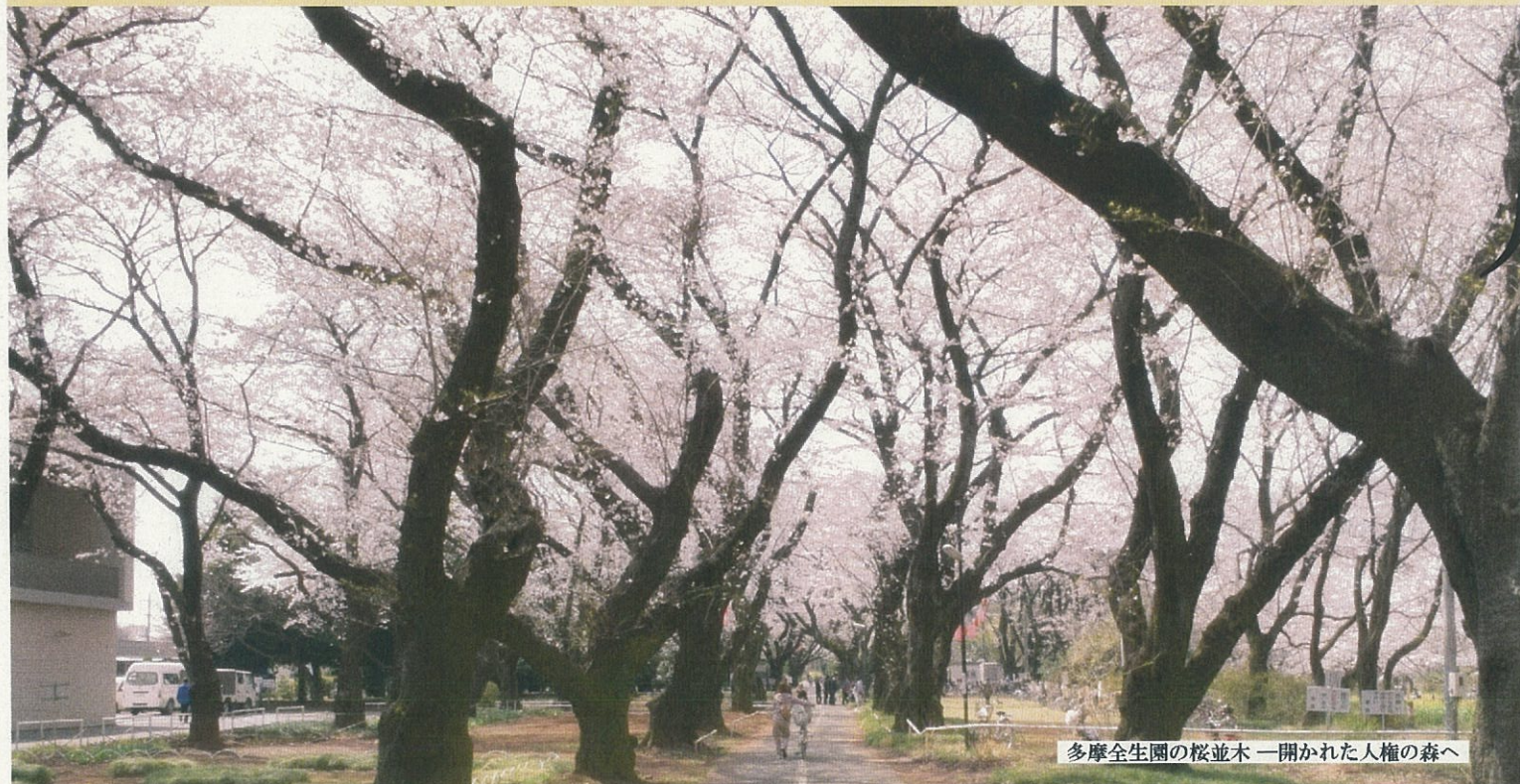
多摩全生園の桜並木 一開かれた人権の森へ